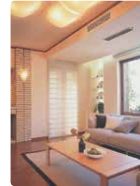
- Tipo duto, qualidade e totalmente invisível;