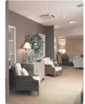
- Tipo Cassete, discreto e eficiente;