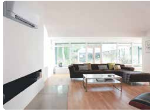
- Hi wall, um equipamento elegante para qualquer ambiente;